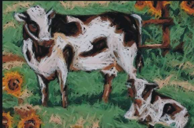
The hope of a happy cow jan. 2004